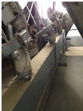
Foto: Vejebånd under siloer. Der laves batch-opblanding til silobatteri over vådfoder-tanke og til silobatteri, som forsyner øvrige sites.