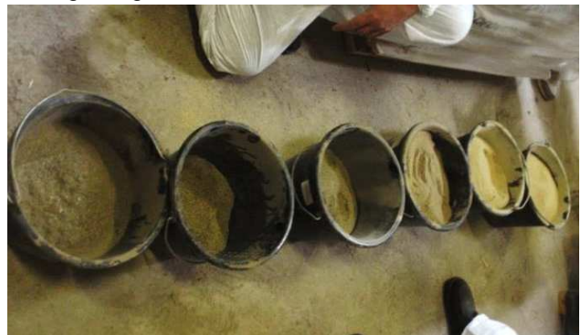
Tydelig farveforskel mellem solsikke- og sojaskrå i prøver fra efterløbskontrollen