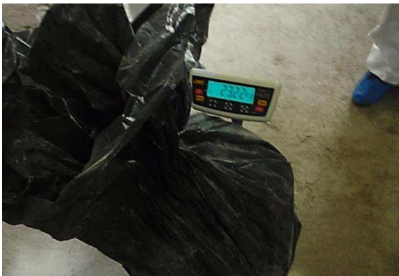
23 kg efterløb