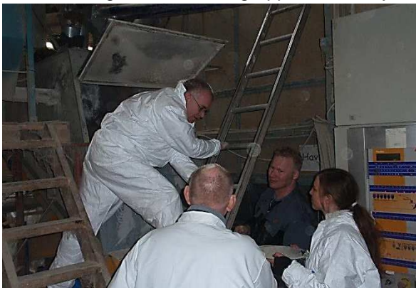
Der udtages prøver til kontrol af efterløb