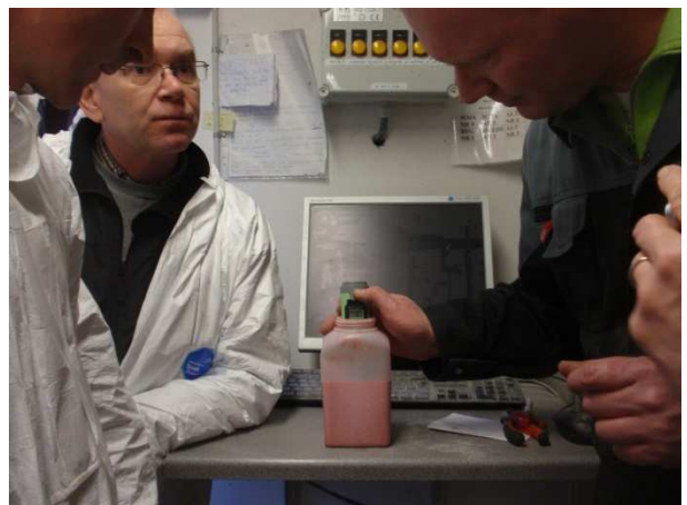
Metoder til pH-måling sammenlignes. (Foderprøven er rød, fordi der er lavet kontrol af recirkuleringstid)