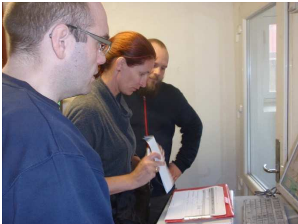
Kontrol af data i fodercomputeren.

De fire nye medlemmer i gruppen fik ved samme lejlighed prøvet de praktiske dele af et vådfodertjek.